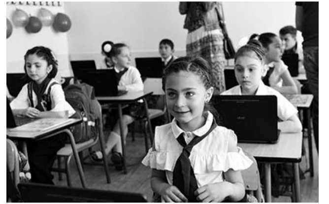
ახლო მომავალში, ახალი სკოლის მშენებლობა დაიწყება და ასევე 2020 წელს დასრულდება. 240 მოსწავლეზე გათვლილი ახალი შენობა თანამედროვე მოთხოვნების გათვალისწინებით აშენდება და მის მშენებლობაზე 3 655 246 ლარი დაიხარჯება.

მინისტრის მოადგილემ ზესტაფონის მუნიციპალიტეტის სოფელ არგვეთში ის ადგილიც მოინახულა, სადაც,