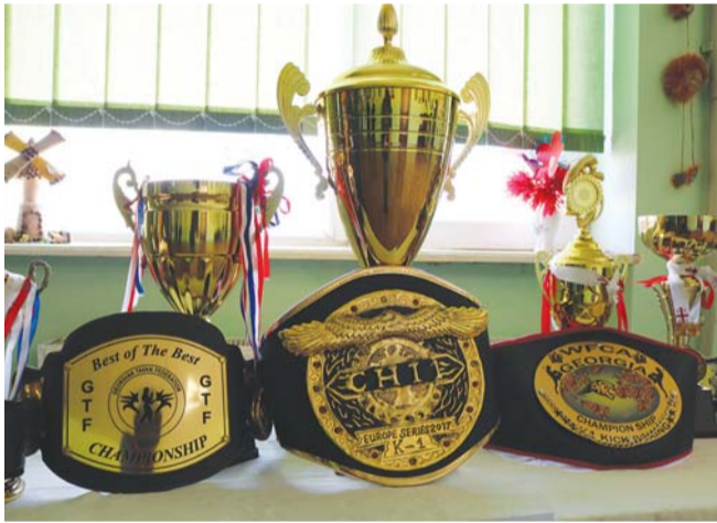
ლუკა გოგობერიშვილის პრიზები