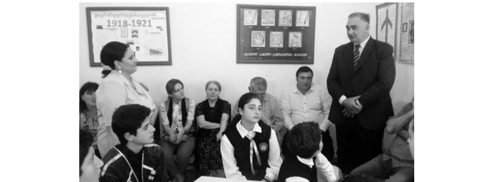
ფაქიზო ფანჩულიძე-კუჭავა სიბ ოტია იოსელიანის სახელობის ქალაქ წყალტუბოს №1 საჯარო სკოლა

აქტივობის აღწერა: მოსწავლეები, როლური გათამაშებით, აუდიტორიის წინაშე წარმოადგენენ განსაკუთრებული პატრიოტული ხასიათის ნაწყვეტებს აკაკი წერეთლის მოთხრობიდან „ბაში-არუკი“.