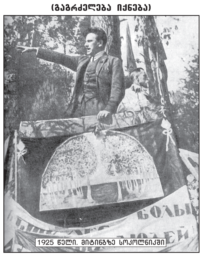
1925 წელი. მიტინგზე სოკოლნიკში

პრაქტიკული შედეგი ერთია: როგორც კი რომელიმე მწერლის პოლიტიკურ შეხედულებათა სიბასრე ჩლუნგდება, ამ მწერლის ავტორიტეტს ამაგრებს არა იმის მიერ შექმნილ ნაწარმოებთა შესწავლა, არამედ ძალა.