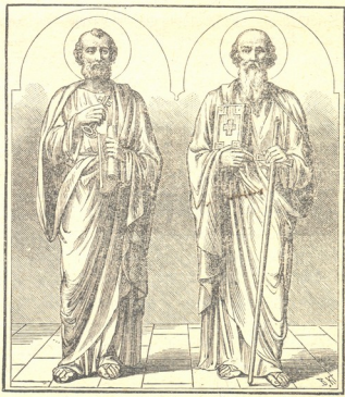
წმიდანი თავნი მოციქულნი პეტრე და პავლე

მძნა ჩემო საყვარელო! მოისმინეთ, ბოლოს, კიდევ ერთი აზრი. ახლა ისეთი დროება დადგა ამ ჩვენს ქვეყანაში, რომელ ჩვენ თანდათან უახლოვდებით, ვიკითხავთ, ვტყობულობთ უცხო ქვეყნების მეტადრე ევროპის განათლებულ ხალხთა ამბავსა, მათსა ზნეობასა, ყოფაქცევასა, აზრსა. საწუხაროდ, მათ შორის არა ყოველიფერი არის კეთილი და მოსაწონი. საუბედუროდ ჩვენდა, ცხადად სჩანს, რომელ მათგან, ესე იგი უცხო, განათლებულის ქვეყნების ჩვეულებათაგან, ჩვენ ხშირად მივიღებთ იმას, რაიცა არ არის მოსაწონი, არამედ არის წინააღმდეგი ღვთისა და ღირსი ძაგებისა; ხოლო რაიცა მართლად არის სასარგებლო და რასაც უნდა ვტყობულობდეთ და უნდა ვაძავედეთ, იმას არ ვტყობულობთ და იმაზედ ყურადღებას არ მივაქცევთ. მაგალითებრ, თვით ის აზრი, რომელსაც ჩვენ ვამტკიცებთ ამ ჩვენს