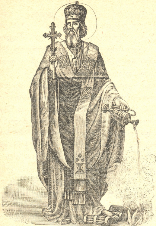
მღვ. მოწ. აბიბოს, ნეკრესის ეპისკოპოსი.

დობიანობისა. სამწუხარო მხოლოდ ისაა, რომ დღევანდელი თქვენი სარწმუნოება აღარ არის მოქმედი და ცხოველი, რომ დღევანდელ თქვენს ცხოვრებამოქმედებაში აღარ სჩანს ამ სარწმუნოების გავლენის კვალი. მძიმე და მომაკვდინებელი ცოდვაა ურწმუნოება, მაგრამ აღარაფრით დაუვარდება მას სარწმუნოებრივი გულკიკობაც, ანუ «ნელ-ტფილობა». აი რას უბძანებს ღმერთი წმ. იოანე ღვთისმეტყველის პირით ლავდიკიის ეკლესიის ანგელოზს: ვიცნო საქმენი შენნი, რამეთუ არცა გრილი ხარ და არცა ტფილი... მეგულვების აღმოგდება შენი პირისაგან ჩემისა (გამოცხ. 3. 15 - 16),