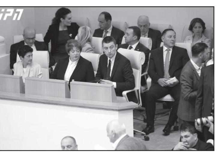
„ჩვენ პერსონალურად არავის ვერჩით, მაგრამ ასეთ პოლიტიკურ კულტურას დავასრულებთ და ამაში ჩვენ მოგვეხმარებიან ჩვენი ამომრჩეველი და ჩვენი მოქალაქეები“

დიახაც, ნათელი და თავისუფალი საქართველო ჩვენი მომავალი და არა ის უზნელესი ან-მყო, რომელიც გვიკავიათ თქვენ. ჩვენ ვაგრძელებთ ისტორიას, ისტორიამ თქვენ უკვე ადგილი გამოგიყვით და ეს არის გავრილოვი და კრემლი. ჩვენიც უცხადესია, ამ ქვეყნის მნიშვნელოვანი წარსული და ამ ქვეყნის დამოუკიდებელი მომავალი. ძალიან ბევრი რამ შემეძლო მეტყვა, მაგრამ ამის თქმა მინდა მხოლოდ და ვნახოთ, გამონვევა თქვენ მიიღეთ ქართული სახელმწიფოს გან. კიდევ ერთხელ შეგახსენებთ, არ დავიზარებ, არც ერთ საქართველოს მოქალაქეს მრავალსაუკუნოვანი ქვეყნის ისტორიის მანძილზე არ უთქვამს, რომ მოლაპატეა, ან რა მნიშვნელობა აქვს, ნების თუ უნებლიეთ მოლაპატეობის რჩევა ჩაიდინა, საუკუნეებმა გაუძლო მათ რეალურ ნაბიჯებს, რადგან ეს თქვენ იცით მშვენივრად.