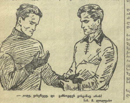
— აღი, ვახუშტი და გიგინევი ვიხსენებ აინი... — აღი, ვახუშტი და გიგინევი ვიხსენებ აინი...