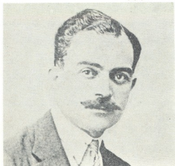
ეროვნული გმირი, პოლკოვნიკი ქაიხოსრო ჩოლოყაშვილი.