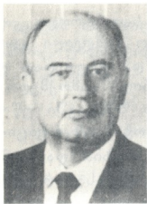
ა. ს. გორბაჩოვი,