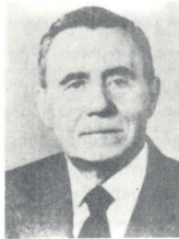
ა. ა. გრომიოვი,