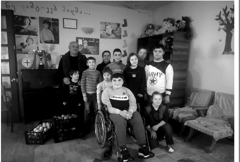
პატარა ნუკი ჯერ მოსწავლეა, მაგრამ არ გაგვიკვირდება თუ მამის კვალს გაჰყვება და სოფლის მეურნეობით დაინტერესდება.

თავი დავანებოთ მხატვრულ გადახვევებს, თუმცა ასეთი დოვლათის