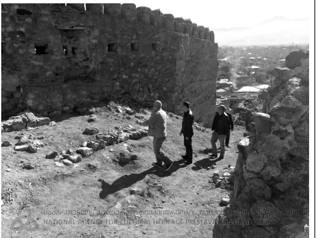
საქართველოს კულტურული მემკვიდრეობის დაცვის ეროვნული სააგენტო NATIONAL AGENCY FOR CULTURAL HERITAGE PRESERVATION OF GEORGIA

მნიშვნელოვანია როგორც ისტორიული და მონუმენტური ხელოვნების ნიმუში. ციხესიმაგრე სხვადასხვა ნაგებობათა კომპლექსია. მასში შედის: გაღავანი, ციხე, წმინდა გიორგის ეკლესია და სასახლე. ციხის ფართობია 1200 მ. ოგი შედგება ორი ნაწილისაგან: შიდა ციხისა (ციტადელი) და ქვედა ეზოსაგან.