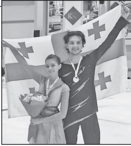
და ბრინჯაოს მედლები დაიმსახურეს.

ჩვენებურებმა სავალდებულოზე გაცილებით მაღალი ტექნიკური ქულები მოაგროვეს და სენიორებს შორის 2020 წლის ევროპისა და მსოფლიოს ჩემპიონატებში გამოსვლის უფლება მოიპოვეს, ხოლო ტურნირზე აღებული 174, 63 ქულით მე-3 ადგილი