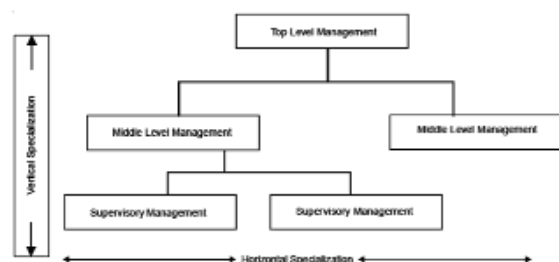
Figure.1 Structure of bureaucracy

The famous German sociologist Max Weber introduced the theory of Bureaucracy. His major contribution to the theory is the concept of authority, structure and its inter-se relationship. Weber in his model of bureaucracy stated that there are three types of authority in any organization: legal authority, Traditional authority, charismatic authority.