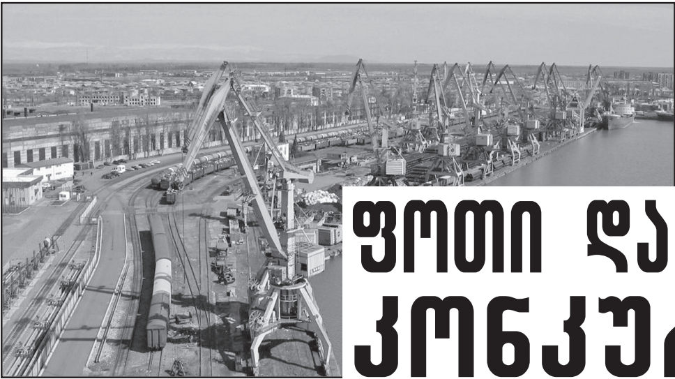
საქართველოს აკონომიკური მომავლისა და განვითარების მთავარი მიმართულება შავი ზღვა, საქართველოს შავი ზღვის შელფი, აკონომიკური ზონა, კონტინენტი

სამწუხაროდ, საქართველოს სახელმწიფოს ვერცერთმა ხელისუფლებამ სახელმწიფოებრიობის აღდგენის მესამედი საუკუნის მანძილზე ვერ მოახერხა ხანგრძლივადიანი სტრატეგიის შემუშავება და სტრატეგიული მიზნების შესაბამისად მოქმედება. პირიქით, მოქმედება ხდება იმპულსურად, არათანმიმდევრულად, ჯგუფური და პოლიტიკური კონიუნქტურისა და ინტერესების მიხედვით. ეს საქართველოს მხრიდან.