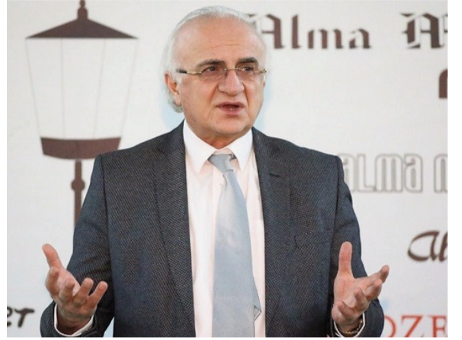
ცესის წარმართვისთვის. მხედველობაში მაქვს არა მარტო დასკვნითი გამოცდების ჩატარება, არამედ ლაბორატორიული თუ კლინიკური პრაქტიკების ორგანიზება.

როგორც ცნობილია, საქართველოს განათლების, მეცნიერების, კულტურისა და სპორტის მინისტრმა მიხეილ ჩხენკელმა, კორონავირუსის პანდემიის ფონზე, განათლების სფეროს ყველა მიმართულებით ანტიკრიზისული გეგმა წარმოადგინა. მან საგანგებოდ განაჩინა, რომ უმაღლეს საგანმანათლებლო დაწესებულებებს მიეცა შესაბამისი რეკომენდაციები სტუდენტთა სწავლის საფასურის გადახდის საშუალებით პოლიტიკასთან დაკავშირებით. უნივერსიტეტებში სემესტრის ფარგლებში სტუდენტებისთვის შეთავაზებულია გადახდის მოქნილი ინდივიდუალური გრაფიკი ან გადავადებული სწავლის გადასახადი. ფინალური გამოცდები უმაღლეს სასწავლო დაწესებულებებში უნდა ჩატარდეს შეზღუდვების შემსუბუქების მიქცევა ეტაპზე. რაც შეეხება სადიპლომ ნაშრომებს, მათი შესრულება და დაცვა მოხდება ინდივიდუალური გრაფიკის მეშვეობით, სტუდენტისა და ხელმძღვანელის შეთანხმების საფუძველზე. საინტერესოა, როგორ ართმევენ თავს სამინისტროს რეკომენდაციებს უნივერსიტეტები. ამ საკითხებთან დაკავშირებით გრიგოლ რობაქიძის სახელობის უნივერსიტეტის რექტორს, მამუკა თავხელიძეს ვისაუბრეთ.