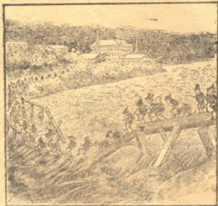
ფაქო ფუციში გაღვიანი გაბატავა

— ნუ გეშინიან, ვერ დაიხრჩობი, წვალი ღრმა არ არის, უპახუნა სიცილით არვიცაიამ, რომელიც მის გვერდით მიცურავდა.