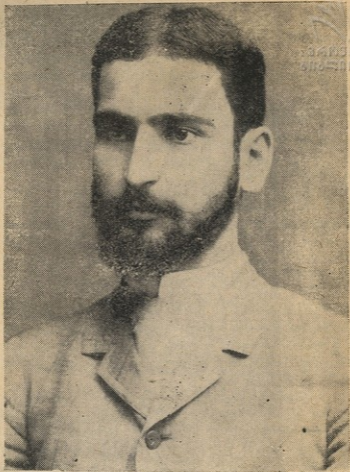
მიტროფანე ლალიძე 900-იან წლებში