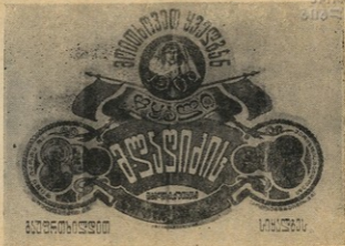
შიტროვანე ლაღობის წარმოების ემბლემა