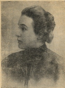
ოლიმპიადა ვახანია-ლალიძისა (1883—1942).

რების შემდეგ მას პეტერბურგსა და რუსეთის სხვა ქალაქებში გზავნიდა.