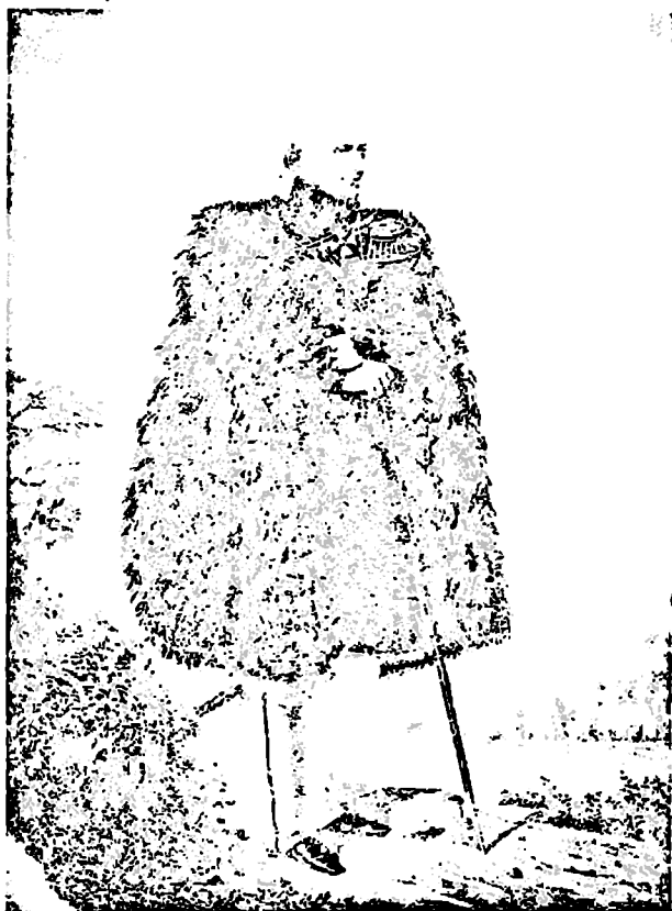
მ. ს. მოროვოვი მეფისნაცვლი კავკასიაში 1845 – 1854 წ.წ.