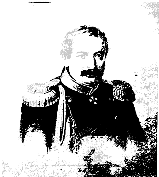
მ. ზ. არღუთინსკი - დოღოგოკოვი

კასპის მხარეთა გამგებელი და ჯარების სარდალი დაღესტანში 1847 – 1854 წ. წ.