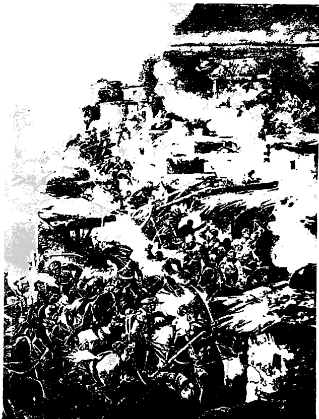
დრაგუნების იერიში აულ ქუთიშაზე 1846 წ.