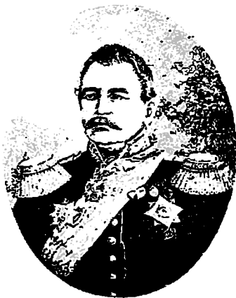
ფ. კ. კლუკი — ფონ-კლუგენაუ ჯარების სარდალი ჩრდ. და შოიან დაღისტანში 1841 — 1844 წ. წ.