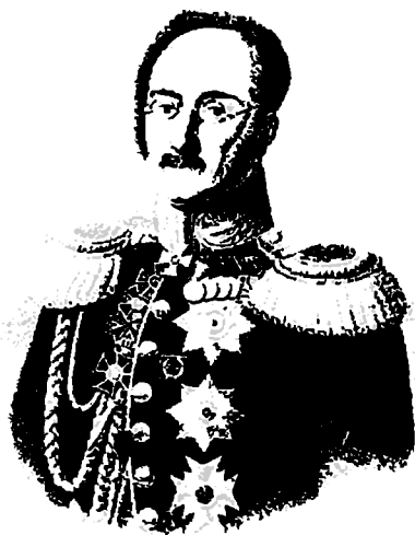
ალ. ივ. ნიღზაძე კავკასიის მთავარმართებელი 1842—1844 წ. წ.