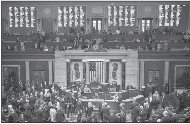
პროგრამებს. ამავდროულად, კანონპროექტი სახელმწიფო მდივანს უფლებას აძლევს, უარი თქვას აღნიშნულ შეზღუდვებზე, თუ ეს აშშ-ის ეროვნული ინტერესებისთვის მნიშვნელოვანია.

კანონპროექტში ასევე აღნიშნულია, რომ თანხის გამოყოფის შეჩერება არ შეეხება დემოკრატიის, კანონის უზენაესობის, სამოქალაქო სექტორისა და მედიის განვითარების, გენდერული ძალადობის აღმოფხვრისა და მონაცვლადი ჯგუფების დახმარების