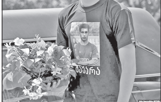
ბოდენ და რისხვა, ზოგადად, ხელისუფლებისა და, კონკრეტულად, შს-ს წინააღმდეგ არ მიემართათ?