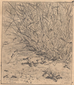
ჭიანჭველები სწამებდნენ ბოინჯის ყოველ ძირს.

რამოდენიმე დღე დაურჩი ჭიანჭველებთან. მძუნური დღე- ები იყო: ეველა მიუღიდა, ეველა ცდილობდა სხუასე მუტი თანაგრძობა ეხეხებინა ჩემთვის. რა კეთილი და შესანიძნავი, ჭიანჭვიანი ჭიანჭველები იყვნენ. ბევრს მუშაობდნენ და კარვად მიდიოდა მათი საქმე.