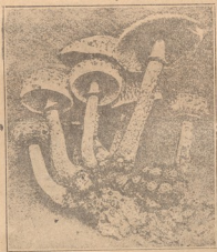
ჭიანჭველების მოფინილი სოკოს ყანა

ნაცარა ჭიანჭველები დილა-აღრიან, ზორული მზის ქვეშა რომ შემოანათებდა, უანებისკენ მიემჯობოდნენ. ეველასე ყურო იძის ცდილობდნენ, რომ რაც შეიძლება მეტი ადგილი გაე- წმინდათ, ნაკადვი მოემორებიათ. როცა მიწას მოამსადებდნენ, მარცვლებს მოიტანდნენ და სთესავდნენ. ამოვიდოდა თუ არა მათი სუუარელი ბრინჯი, ცუდ ბალახს აცლიდნენ. მერე, რო- გორც ნამკლით, თავისი ებებით ისე სჭრიდნენ და ზურის მა-