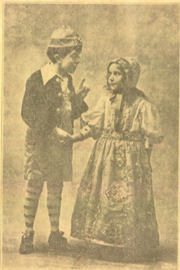
ტაღტილი და მიტლი.