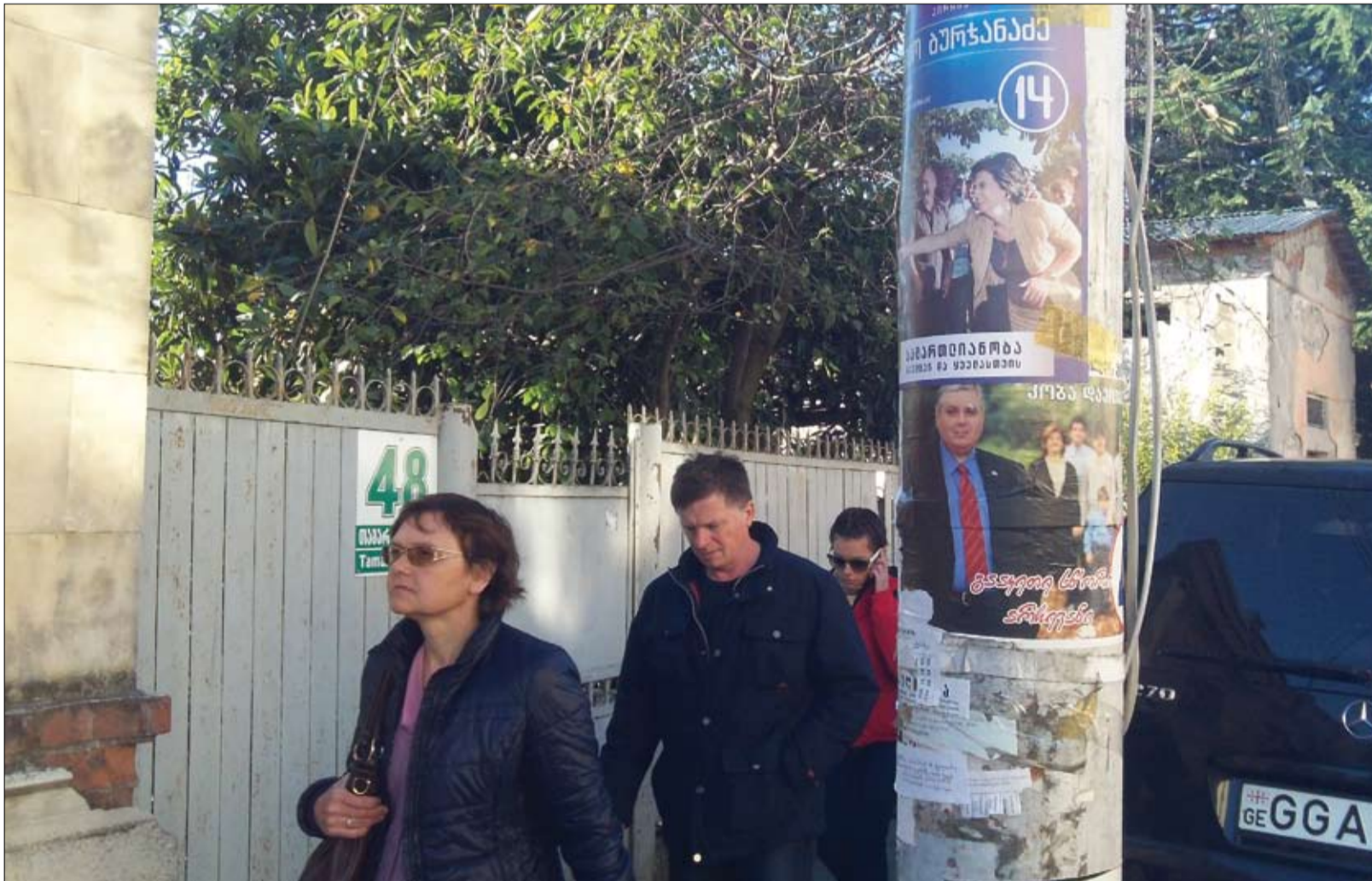
„P.S. ფოტო“