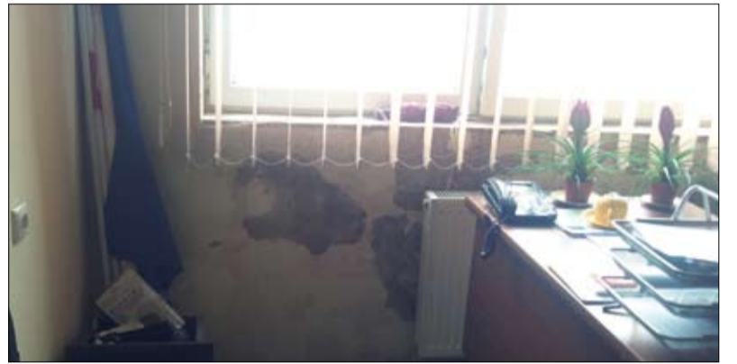
ლაზიანავალი კაბლოვი ოპერის თეატრში

„დაგ“-მა ორი წლის წინ, ტენდერის საფუძველზე, ოპერის თეატრის მშენებლობა დაიწყო. ქალაქის მერი-ასა და სს „დაგ“-ს შორის გაფორმებული ხელშეკრულების მიხედვით (ხელშეკრულება სახელმწიფო შესყიდვების შესახებ: №2, №236, №560), თეატრის რეკონსტრუქციისათვის ცენტრალური ბიუჯეტიდან 3627324.5 მილიონი ლარი იყო გამოყოფილი. მშენებლობის პროცესი 7 თვის განმავლობაში მიმდინარეობდა, თუმცა, შენობა დღემდე არ არის ჩაბარებული იქ არსებული პრობლემების გამო.