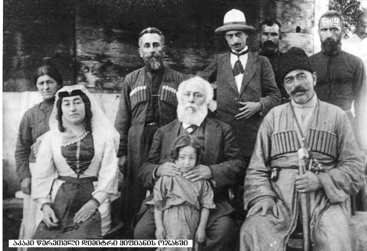
აკაკი წერეთელი დიმიტრი ყიფიანის ოჯახში

დიმიტრი ყიფიანსა და ნინო ჭილაშვილს ჯვარი 1845 წლის 22 ივნისს დაუწერიათ. ცოლ-ქმარს ექვსი შვილი შესძენიათ. 3 მცირეწლოვან ასაკში გარდაცვლიათ. დანარჩენი სამი შვილის შთამომავალნი დღესაც ცხოვრობენ თბილისში, ქალაქში, რომლის „თავი“ და მეთაური სახელოვანი დიმიტრი