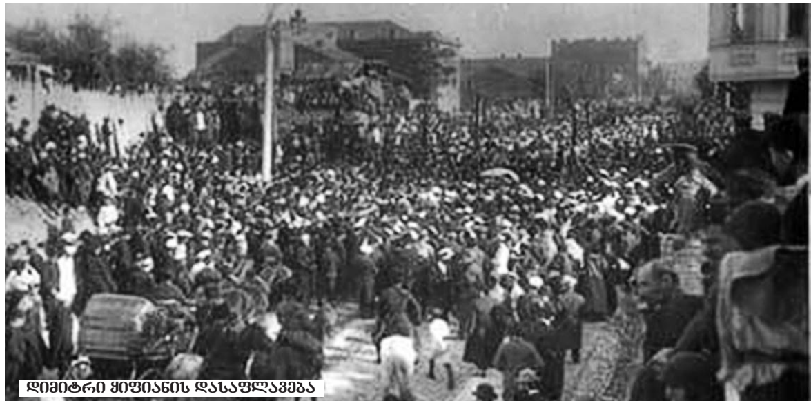
დიმიტრი ყიფიანის დასაფლავება