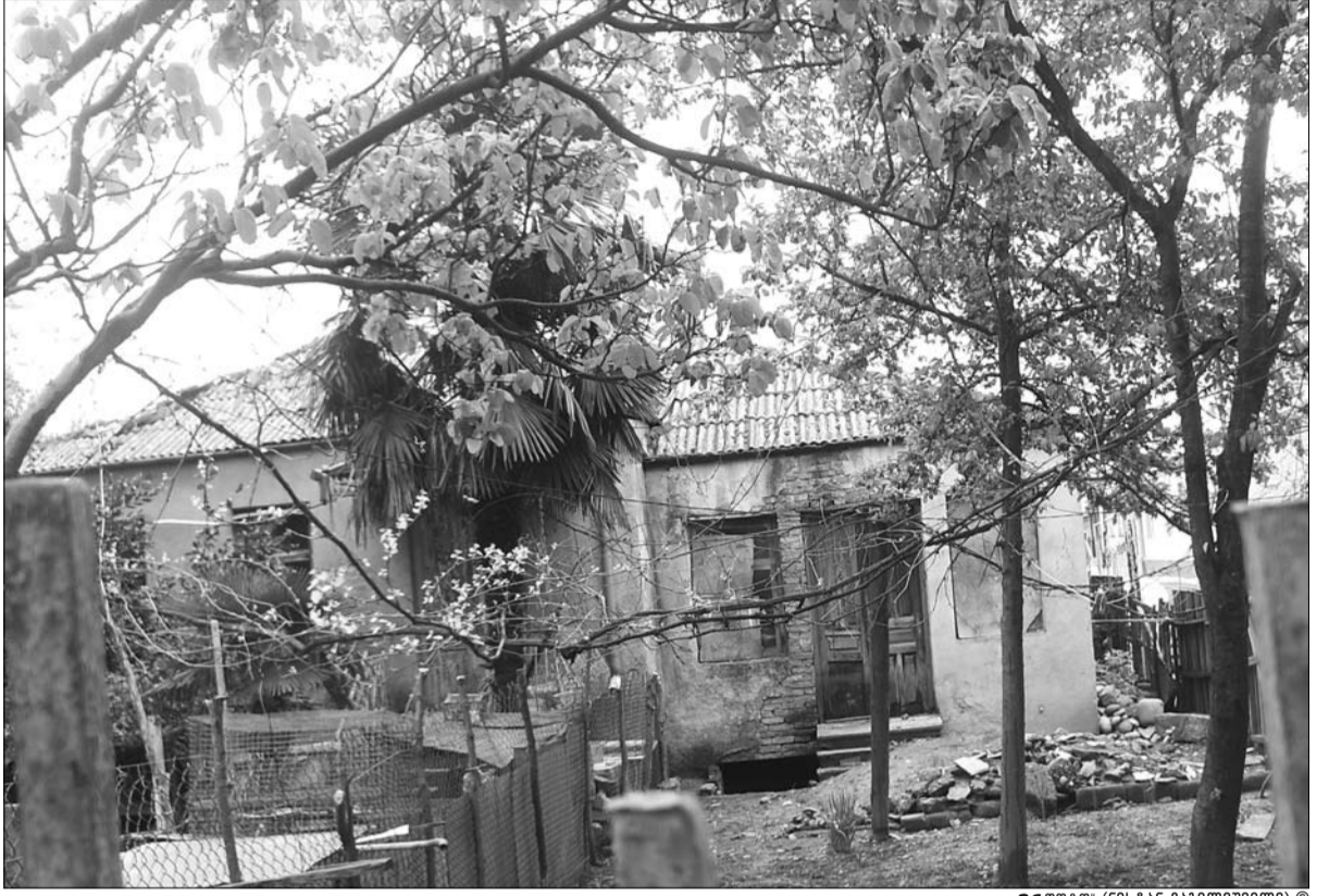
სადამო სახლი რუსთაველის გამზირის №75-ში.