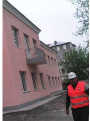
იხილეთ მე-3 გვერდზე

დევნილთა ბრძოლვადიანი განსახლება მაინიდან დაიწყება