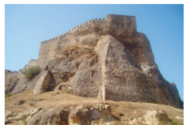
ოპოზიციას საქართველო სურამის ციხე ჰგონია, რომლის კედლებში ზურაბის ნაცვლად ბიძინა ივანიშვილი უნდათ ჩაატანონ