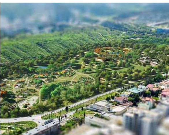
ფართომასშტაბიანი ბნელა „ნასიონალუბრი“