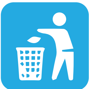
ნაგვის გატანის შემდეგ