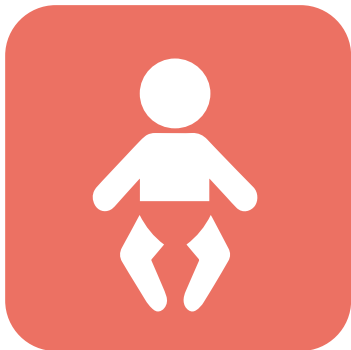
საფენის გამოცვლამდე და შემდგომ