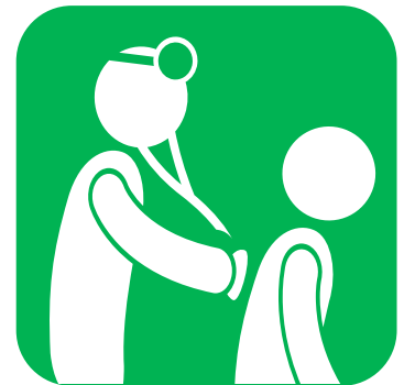
ავადმყოფთან ვიზიტისა და მასზე ზრუნვის წინ და შემდეგ