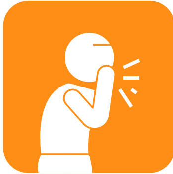
ხელის, ცემინების და ცხვირის მოხოცვის შემდეგ