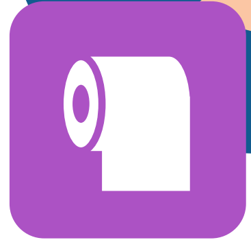
ტუალეტით სარგებლობის შემდეგ