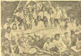
აფხ. დ. კანდელაკის სახელობის ნორკ პიონერთა კოლექტივი. კოლექტივი დაარსდა 1925 წელს სსრკ-ში.

განათლების სახალხო კომისარიატის სოციალურ აღზრდის მთავარმართველობის და ახალგაზრდათა კომკავშ. ცენტრ. კომიტ. ყურნალი ბავშებისათვის.