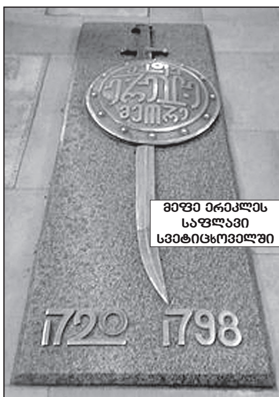
მეფე ერიკლის საფლავი სვეტიცხოველში

ამასობაში ირანში მიმდინარე მძაფრ შინაომებში გაიმარჯვა ალა-მაჰმად-ხან ყაჯარმა. მისი ზეობის პირველივე წლებიდან აღმოჩნდა, რომ ქართლ-კახეთში ირანის ბატონობის აღდგენა სურდა.