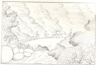
სამი მგზავრი ერთი ცხენით დილა ადრიან გაუდგა გზას.

— ჩვენ აგერ იმ ხის ძირს დავიძინებთ, — მიუთითა ნიკომ ერთ ცალკე მღვამ მუხაზე, რომელიც ცეცხლიდან 40 ნაბიჯით მაინც იყო დაშორებული. — ცეცხლი კი იმიტომაა საჭირო, რომ აქ ბევრი მუშლი და კოლო იცის, ღამე ყველა ცეცხლს მიეტანება და ჩვენ არას გვაფეხებენ. ესეც ჩასწერეს მაშინვე და ბედნიერები გაეხევიან ნაბდებში.