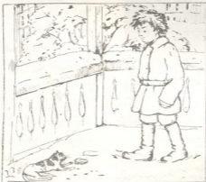
ტუგუში დასცქერის მკვდარ კატას.

„აღბათ, მოკვდება. აღბათ, ძალიან შიდა და იმიტომ არის ასეთი გამხდარი... მკვრამ რატომ ჩემ ზურს არ სჭამს? ნუთუ მოკვდება? ვინა კატა? მოდი ჩემი ქურჭი დავახურო?... აი ასე“