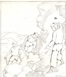
აი აქედან იწყება სამი მდინარის სათავე.

ნუთუ ესაა ბორბალო? აქ არის ალაზანის, იორის, არაგვის, ყოისუს და არგუნის სათავე! ხუთი დაუღეგარი მდინარე!