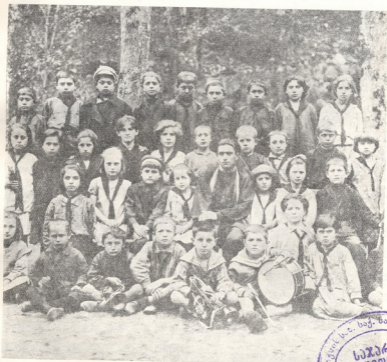
სოფელი ახალდაბის (გორის მაზრა) ოქტომბრელები.