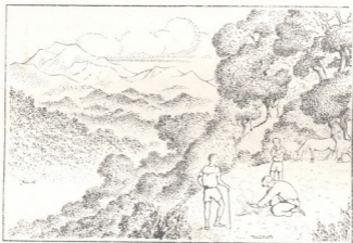
გოგის მამა შეუღდა ცეცხლის დაწოებს.

— ოჰ, როგორ მიყვარხარ, ალაზნის სათავევ!—წამოიძახა გოგიმ და თოვლიანი მთებისკენ გაიშვირა ხელი.