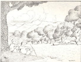
კაკალ ქვეშ ორი ამხანაგი წამოწოლილიყო

— არ ვიცი, მეც ბევრი ვიფიქრე, მაგრამ არა გამოვიდა რა.