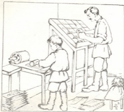
ტუგუში შველის პროკლამაციების დამზადებას

შოტს თოფების სროლა გაისმა. საკვირველი რამ ხდებოდა ამ ქალაქში. თითქმის ერთი წელიწადია, რაც ძამამ წამოიკვანა ტუგუ- ში ბქეთევენ, მოაშორა თავის ტოლ-ამხანაგებს.