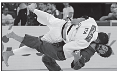
ნეს იპონით მოუგო და ბრინჯაოს მე- დალს დაეუფლა.

საქართველოს ძიუდოისტთა ახალგაზრდა ნაკრებმა ევროპის 23-წლამდელთა ჩემპიონატზე 8 მედა- ლი მოიპოვა და გუნდური პირველი ადგილი დაიკავა. პირველ დღეს ნაკ- რებმა 3 მედალი მოიგო, ხოლო მეორე დღეს 5 მედალს დაუფლდა.