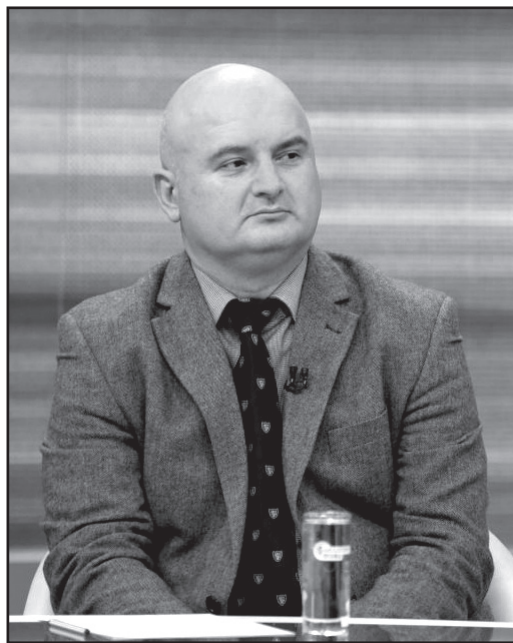
აზრზე მოვიყვანოთ და ა.შ. ეს ხელს არ უშლის დიალოგს?

— კობახიძე გამოდის, დესტრუქციული ოპოზიციის უწოდებს და ამბობს, ზოგიერთ ძალას