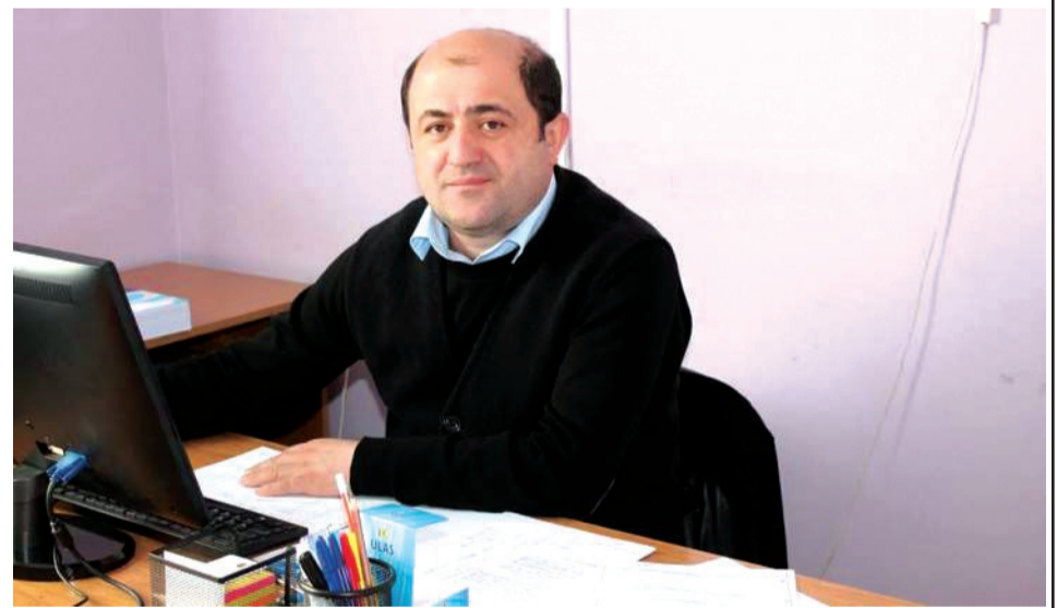
ტის მერის პირველი მოადგილის მოვალეობას. ჰყავს მეუღლე და ორი შვილი.

2017 წლის დეკემბრიდან ასრულებდა საშურის მუნიციპალიტე-