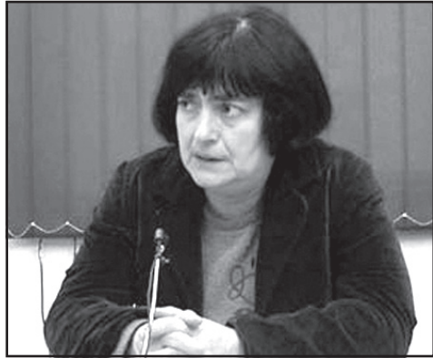
„ხელისუფლება ასრულებს ქვეყნის ეკონომიკის საბოლოოდ მოკვლის ამოცანას“

— ვადამდელო არჩევნები ისედაც დასანიშნები იყო, მაგრამ არ ჩანს, რომ „ქართული ოცნების“ წარმომადგენლები ამას აპირებდნენ. ისინი ამას არ თანხმდებიან. ოპოზიციას ვადამდელო არჩევნებს ისევე მოითხოვს. საერთოდ, ოპოზიციის ერთიანობა და მიზანსწრაფობა მისასალმებელია. პარლამენტში არ შესვლა ამ შემთხვევაში სწორი გადაწყვეტილებაა. ბევრი ოპოზიციონერი კარგად ვეღვაბა ამ ბოიკოტის მნიშვნელობას. ნაწილი ვერ აცნობიერებს, რამდენად მნიშვნელობა აქვს ამას. კარგია, რომ ეს ნაწილი აყოლილი