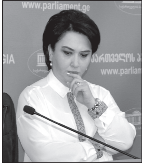
ვინ გააკეთა მასზე ფსონი და უნდა გავიგოთ ეს იმგვარად, რომ კალაძე და კობახიძე ერთი გუნდია?

— თქვენ გაიხსენეთ, როდესაც კობახიძე კალაძემ მოიყვანა პარტიაში. რა შეიცვალა მას შემდეგ და როგორ იქცა ის პარტიის ლიდერად?