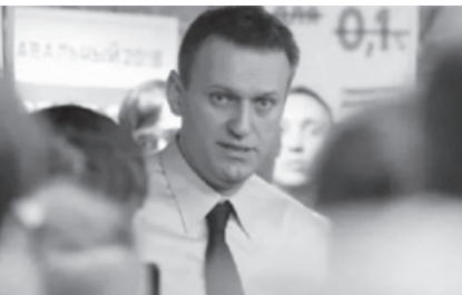
მოამზადა ნიკა თევზაძემ

შეგახსენებთ, ალექსეი ნავალნი ბერლინის კლინიკაში სამკურნალოდ 2020 წლის აგვისტოს, ნერვული აგენტით მოწამელის შემდეგ გადაიყვანეს.