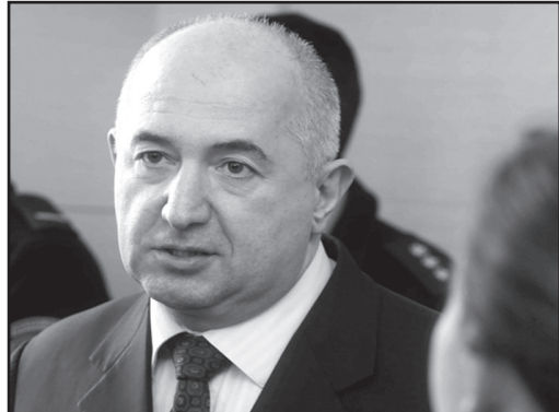
არც ამას შეუძლია ხელს ივანიშვილი, პირიქით, ენდობება ეს პროცესი.

— მას უნდა, თავისი პარტია, გახდეს პარტია. ამდენ ხანს პარტია იყო ივანიშვილის, დღეს კი უნდა, რომ ამ პარტიას ერქვას არა ივანიშვილის, არამედ ივანიშვილის დამცველი პარტია. მას ურჩევნია, რომ ამ პარტიიდან ამოიშალოს რამდენიმე პარტია, ერთმანეთს კონკურენცია გაუჩინოს, თუნდაც ერთმანეთი დაჭამოს. რადგან ივანიშვილი ხედავს, რომ ვერა და ვერ შედგა ეს პარტია. სუქდება და სუქდება ივანიშვილის ფულით. დასაკლავად გამზადებული ღორივით არის, მოძრაობა რომ აღარ შეუძლია და ღრუტუნებს და ღრუტუნებს. ეს პარტია შესაძლოა დაიშალოს კიდევაც.