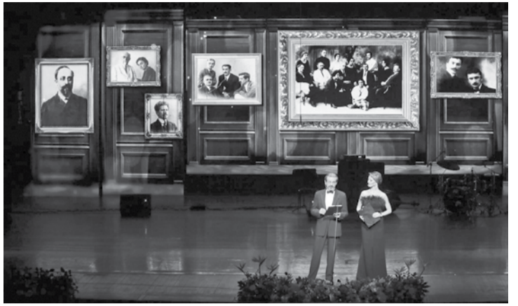
თბილისის ოპერისა და ბალეტის თეატრში