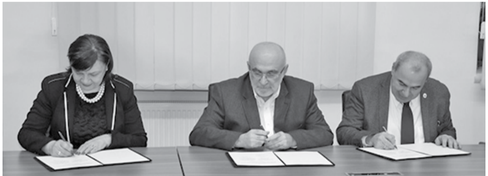
თსუ-ის საზოგადოებასთან ურთიერთობის დეპარტამენტი

ხელშეკრულების საფუძველზე საუნივერსიტეტო კლინიკა უზრუნველყოფს თსუ-ის მედიცინის ფაკულტეტის სტუდენტების და რეზიდენტების მიერ სასწავლო კურსების გავლას. აღნიშნული კურსის გავლისას საუნივერსიტეტო კლინიკა უზრუნველყოფს მის მმართველობაში არსებული სამედიცინო აღჭურვილობის, ადამიანური და სხვა აუცილებელი რესურსების მონაწილეობას.