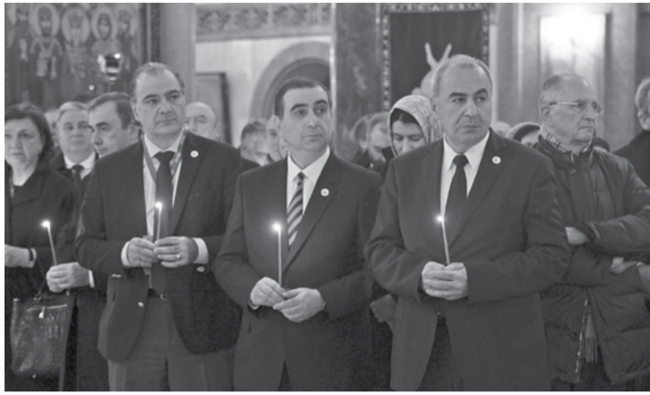
სამების საკათედრო ტაძარში

თბილისის სახელმწიფო უნივერსიტეტისა და, ზოგადად, სამეცნიერო საზოგადოებისთვის საერთაშორისო კავშირების გაფართოების მნიშვნელობაზე ისაუბრა უნივერსიტეტის რექტორმა გიორგი შარვაშიძემ. მან აღნიშნა, რომ საქართველოში არსებული მძიმე ეკონომიკური მდგომარეობის გამო უმაღლესი განათლებისა და სამეცნიერო საქმიანობის ხარისხმა იკლო, რამაც, საბოლოო ჯამში, ქვეყნიდან ნიჭიერი და პერსპექტიული ახალგაზრდების გადინება გამოიწვია. ქართველი მეცნიერები დღეს მსოფლიოს სხვადასხვა ქვეყნის 250 უნივერსიტეტში მუშაობენ და საკმაოდ დიდი წარმატებით იმპიდირებენ თავს. ეს, ერთი მხრივ, კარგია, მაგრამ, მეორე მხრივ, ინვესტ ქვეყნის ინტელექტუალური პოტენციალის შემცირებას. „2013 წლიდან სიტუაციამ გამოსწორება