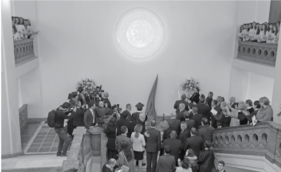
ლოგოს გახსნის ცერემონია

მან, ასევე, ისაუბრა იმ დაბრკოლებებზე, რაც უნივერსიტეტს საქართველოს დამოუკიდებლობის ბოლო 25 წლის განმავლობაში შეხვდა და რამაც სტანდარტული გამოიწვია, თუმცა ისიც აღნიშნა, რომ, მიუხედავად წინააღმდეგობებისა, უნივერსიტეტი გადარჩა და შეინარჩუნა ის ტრადიციები, რაც მას დაარსებიდანვე მოსდევდა — მყარი ეროვნული იდეოლოგია, მეცნიერებისა და კვლევის ევროპული პრინციპები და სწრაფვა მუდმივი განახლებისა და განვითარებისკენ: „მინდა დიდი მადლობა მოვხსენო საქართველოს მთავრობას იმ თანადგომისთვის, რომელსაც უნივერსიტეტი დღეს გრძნობს. ძალიან დიდ ინფრასტრუქტურულ პროექტებს დაუჭირა მხარი მთავრობამ: მეორე კორპუსის სრული რეაბილიტაცია და ინოვაცია; 3000 ადგილიანი საცხოვრებელი ადგილის მშენებლობა; ლისის ტბაზე არსებული ევროპული სტანდარტების 320-ადგილიანი საერთო საცხოვრებლის გადმოცემა, რამდენიმე კვლევითი ინსტიტუტის და კვლევითი ლაბორატორიის