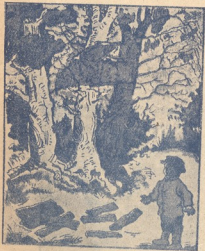
სად ჰქონს მამა, აქ რომ შეშას სჭრიდა?