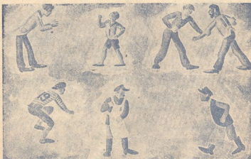
რას აცდებენ ეს ხალხი?

ტომ ამ ბოლო დროს დაიწყეს მიწისქვეშა სახლების შენება. ამასწინათ შეუდგენ მიწისქვეშა დიდი სახლის შენებას, რომელიც 80 სართულიანი იქნება.