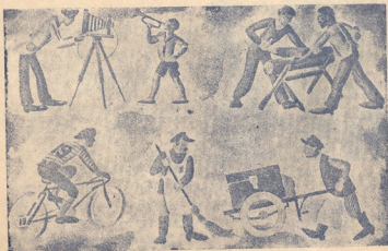
ა ი რ ა ს ა კ ე თ ე ბ ე ნ .

6. შეწუხდა ლანგარნაკი, აღარ იცის რა ქნას, გამწარებულმა მოიძრო თავიდან ქუდი და დაანარცხა დედამიწაზე. მაგრამ უცებ, ჰოი, საკვირველებავ! მაიმუნებმაც მოიგლიჯეს ქულები თავიდან რა გადმოაყოფს თავზე ლანგარნაკს.