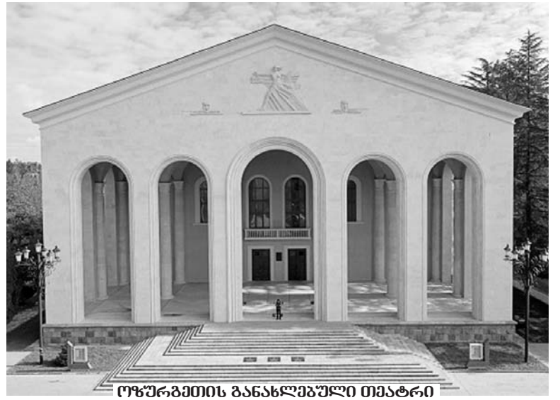
ოზურგეთის განასჯელებული თმატრი

საბაზრო ეკონომიკის პირობებში ხელმძღვანელობის მოვალეობაა, მოქალაქეს შეუქმნას ხელსაყრელი გარემო, რათა მან