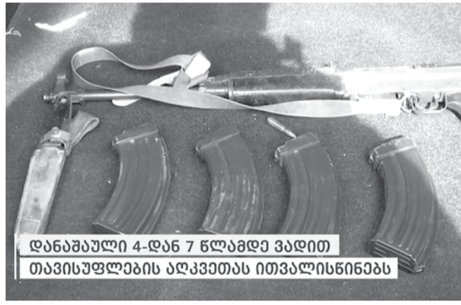
დანაშაული 4-დან 7 წლამდე ვადით თავისუფლების აღკვეთას ითვალისწინებს

გამოძიება მიმდინარეობს საქართველოს სისხლის სამართლის კოდექსის 236-ე მუხლის მე-3 და მე-4 ნაწილებით, ასევე, 239-ე მუხლის მე-3 ნაწილით, რაც გულისხმობს ცეცხლსასროლი იარაღისა და საბრძოლო მასალის მართლსაწინააღმდეგო შექმნა-შენახვა-ტარებასა და ცეცხლსასროლი იარაღით ჩადენილ ხულიგნობას.