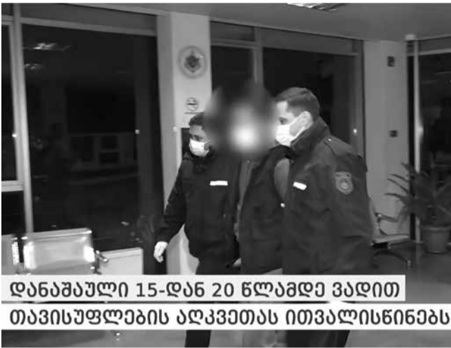
დანაშაული 15-დან 20 წლამდე ვადით თავისუფლების აღკვეთას ითვალისწინებს

გამოძიება საქართველოს სსკ-ის 11 პრიმა 138-ე მუხლის მე-2 ნაწილის „ვ“ და მე-4 ნაწილის „ა“ ქვეპუნქტებით მიმდინარეობს, რაც წინასწარი შეცნობით, თოთხმეტი წლის ასაკს მიუღწეველი ოჯახის წევრის მიმართ ჩადენილი სექსუალური ხასიათის სხვაგვარ ქმედებას გულისხმობს.