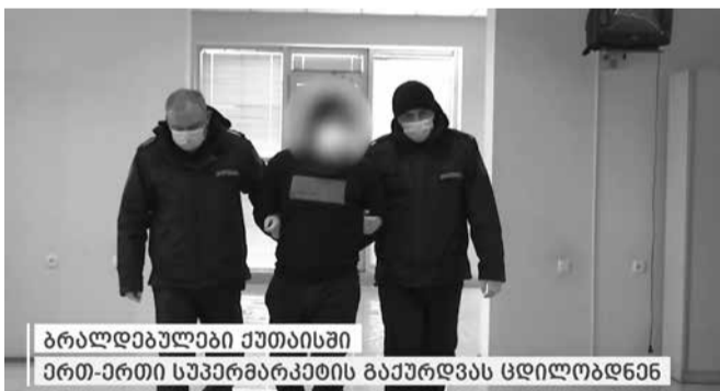
ბრალდებულები ქუთაისში ერთ-ერთი სუპერმარკეტის გაქურდვას ცდილობდნენ

შინაგან საქმეთა სამინისტროს იმერეთის, რაჭა-ლეჩხუმისა და ქვემო სვანეთის პოლიციის დეპარტამენტის ქუთაისის საქალაქო სამმართველოს თანამშრომლებმა, ცხელ კვალზე ჩატარებული ოპერატიული და საგამოძიებო მოქმედებების შედეგად, ოთხი პირი ქურდობის მცდელობის ბრალდებით დააკავეს.