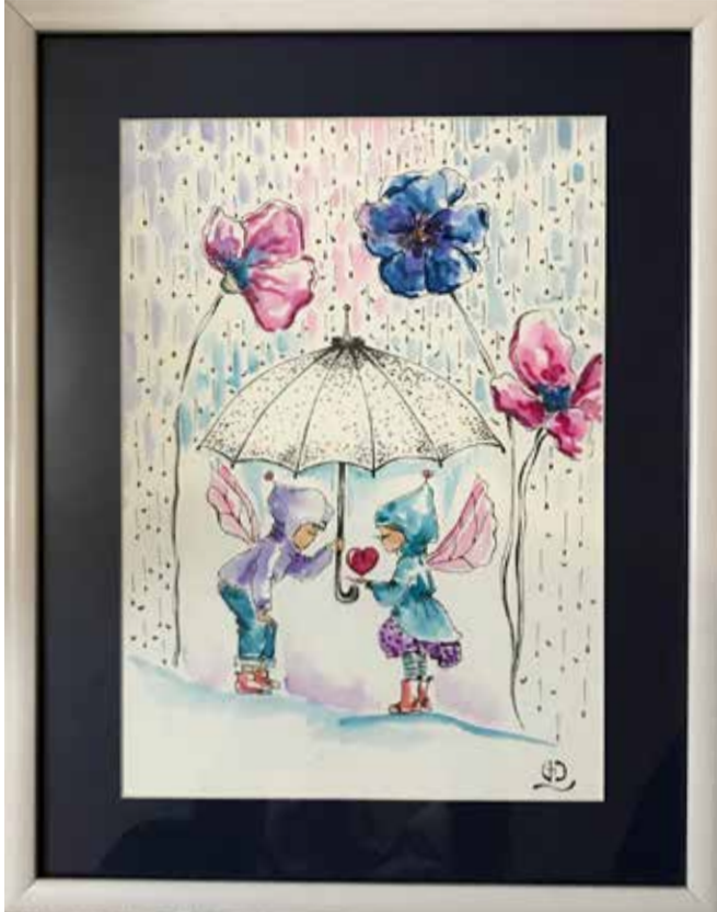
თილიები სიყვარულს უფრთხილდებიან. გრძობას, რომელიც მათ აერთიანებთ, ცივ ნიავს არ აკარებენ, მთელი ცხოვრება სურთ, რომ გული ისეთი მთელი და ბედნიერი იყოს, როგორიც ახლაა. ისინი სიყვარულს არ მალავენ, თუმცა, უფრთხილდებიან, ავდარის დროს იფარავენ, დარის დროს კი მძაფრად ძვერის საშუალებას აძლევენ „გული ზრუნავს“