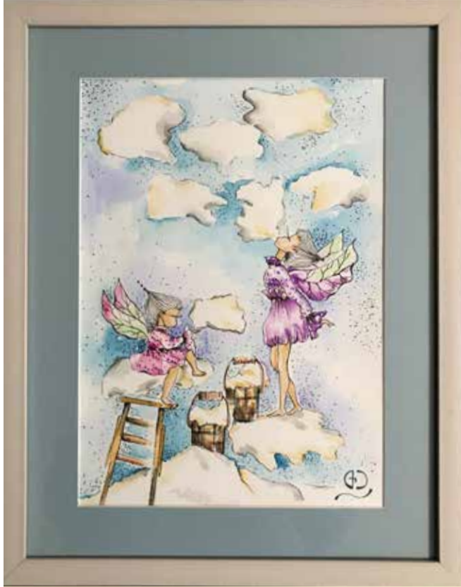
ბედნიერებისგან ლუბლებში ფრენა გინდათ...? თილიებმა გადანყვიტეს ღრუბლები თქვენთვის შეაგროვონ, მათ ხომ სურვილების ასრულება შეუძლიათ... ცაში თუ აიხედავთ, ბედნიერებისფერ ღრუბლებს დაინახავთ, აირჩიეთ ერთ-ერთი, ის უკვე თქვენია... ჩაუთქვით სურვილი და ის აუცილებლად აგისრულდებათ... თილიები კი იზრუნებენ იმაზე, რომ ფაფუკი ღრუბლები თქვენი ბედნიერების სანიღარი იყოს... „ბედნიერებისფერი ღრუბელი“