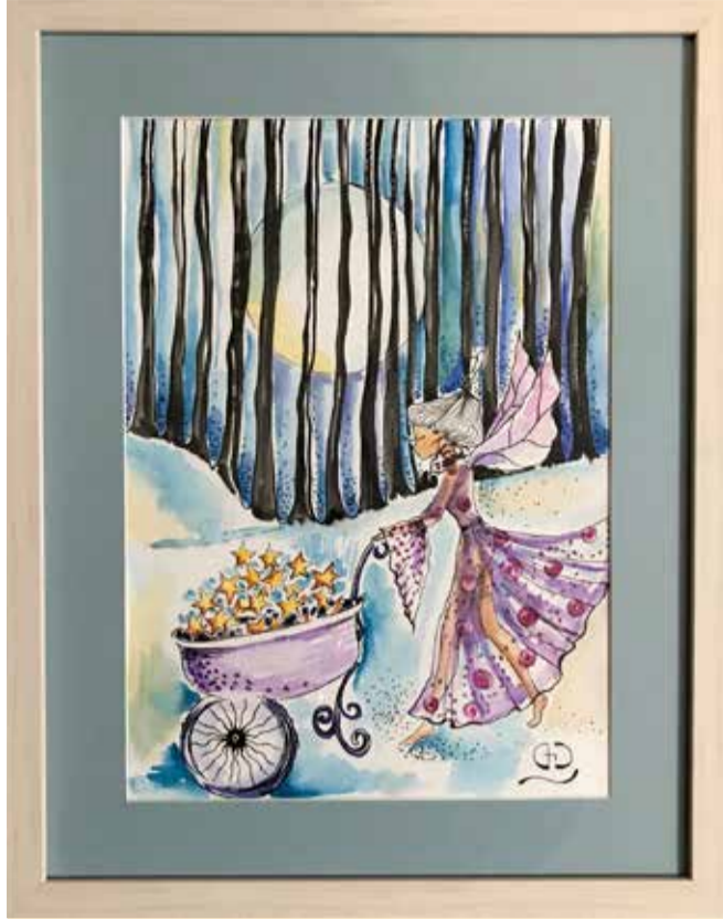
ერთ საღამოს, როცა გზას მთვარის შუქი ანათებდა, თილია გამოჩნდა. ყველამ იცოდა, რომ თილია მხოლოდ კეთილ საქმეებს აკეთებდა, მაგრამ ამას არავინ ელოდა. მას მონყვეტილი ვარსკვლავები შეეგროვებინა. თითოეულ მათგანში კი თქვენი სურვილებია მოთავსებული. კარგად დააკვირდით, სავარაუდოდ თქვენი ვარსკვლავიც აქ არის. „მონყვეტილი ვარსკვლავები“

მივხვდი, რომ გამიჩნდა დრო, ჩემი პროფესიით რაღაც რომ მეკეთებინა და გარკვეული პერიოდის მანძილზე, სამკაულებს ვქმნიდი“.