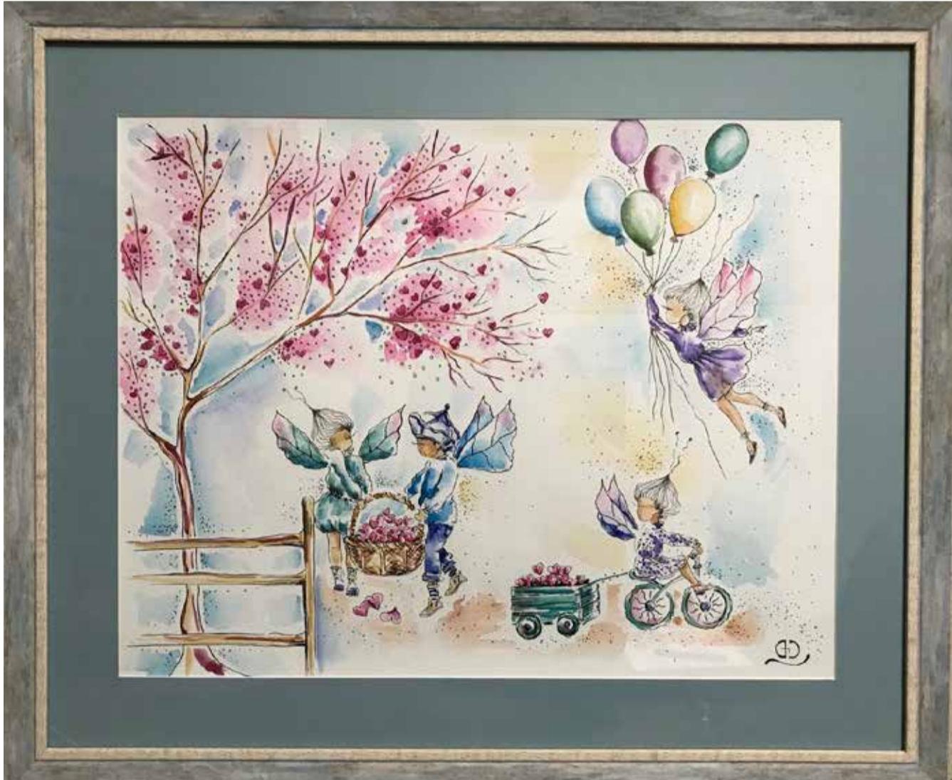
გვიან გაზაფხულზე, თილიების ქვეყანაში, გულების შეგროვების სეზონი დგება. იკრიბებიან, კრეფენ, ერთმანეთში ცვლიან გულებს. მოგროვილი გულები კი მთელი წელი ჰყოფნიან, ჰყოფნიან იმისთვის, რომ ბევრი სიკეთე აკეთონ, სურვილების ასრულება შეძლონ, ბედნიერების მოტანა შეეძლოთ. ამ დროს თილიების ქვეყანაში განსაკუთრებული სურნელი დგება, გულის სურნელი. „გულის მოსავალი“

„დღეს, ჩემი ნამუშევრები ონლაინგალერეაში – mygallery.ge არის წარდგენილი. როცა დამირეკეს და შემომთავაზეს, ძალიან გამეხარდა. რა თქმა უნდა, დავთანხმდი და რამდენიმე ნახატიც წარვადგინე“.