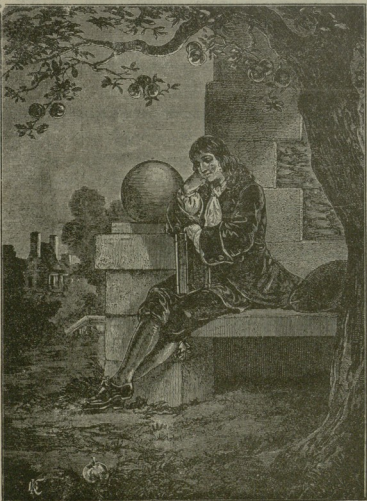
ახალგაზრდა ნიუტონი იტყარას მოძიების ჩაფიქრებას.

სალიტერატურო და სამეცნიერო ნახაზებიანი გაზეთი. გამომდის ყოველ კვირა დღეს.