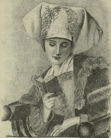
ასსოებით მკითხველი წმინდა სახარებისა.