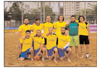
ეთის მუნიციპალიტეტის მერია: სპონსორია „ჩემი მარკეტი“.