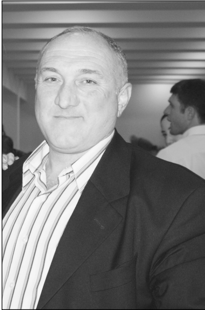
ყოველ 27 მაისს შენს დაბადების დღეს კი არ აღვნიშნავდით, ან ვზეიმობდით, არამედ ვლესასწაულობდით, გამორჩეულად ვლესასწაულობდით, რადგან შენისთანა კაცი იმსახურებდა ასეთ დღესასწაულს.