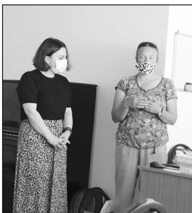
ალიონი. გასულ პარაკვს, ქ. ოზურგეთში, ფოლკლორის ცენტრში კომპანია „სი-სი-ი-ეი VI“-ის გარემოს