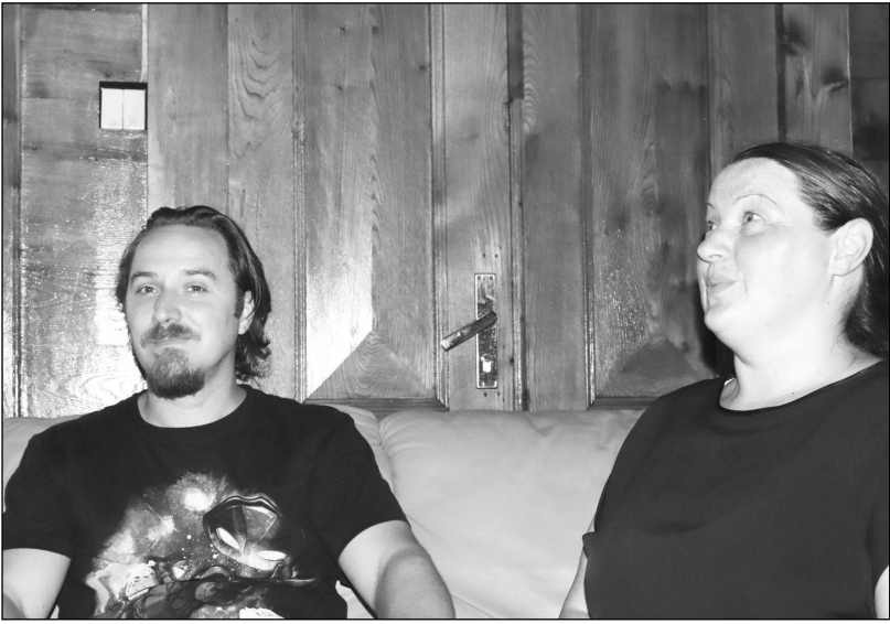
ბურგის ოლქში, ყაზახეთთან საზღვრისპირა დასახლებაში. შემდეგ ბაშკირეთში, უფაში გადავდივით

შემდეგ ბაბუას კვალს გამოვეყვით და საქართველოში აღმოვჩნდი. კვინი ვებ-დისკუსიები, მე – ინგლისურის მასწავლებელი.