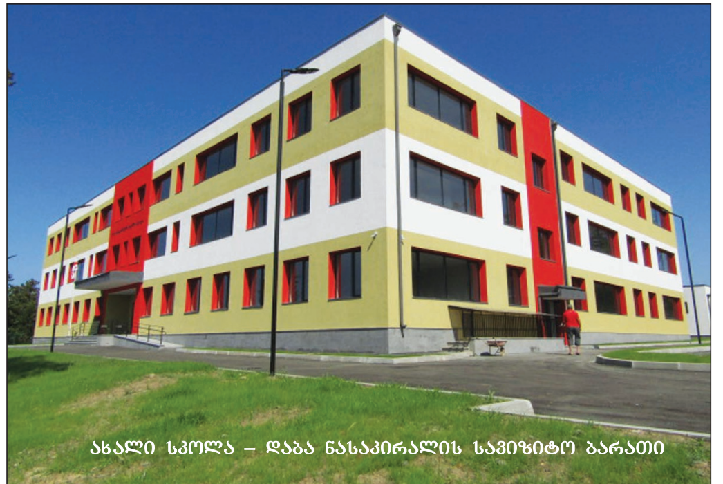
ახალი სკოლა - დაბა ნასაკირალის სამიზიტო ბარათი

ნასაკირალის მეურნეობა დაარსებისთანავე მულტიეთნიკური გახდა. აქ ცხოვრობდნენ რუსები, უკრაინელები, პოლონელები, გერმანელები, ჩინელები, იეზიდები და ა.შ. სულ 14 ეროვნების წარმომადგენლები. შემდეგ, 1969 წელს სოფელში დასახლდნენ სტიქიით დაზარალებულები შუაჩხვის, ხულოს და ჩოხატაურის რაიონებიდან--