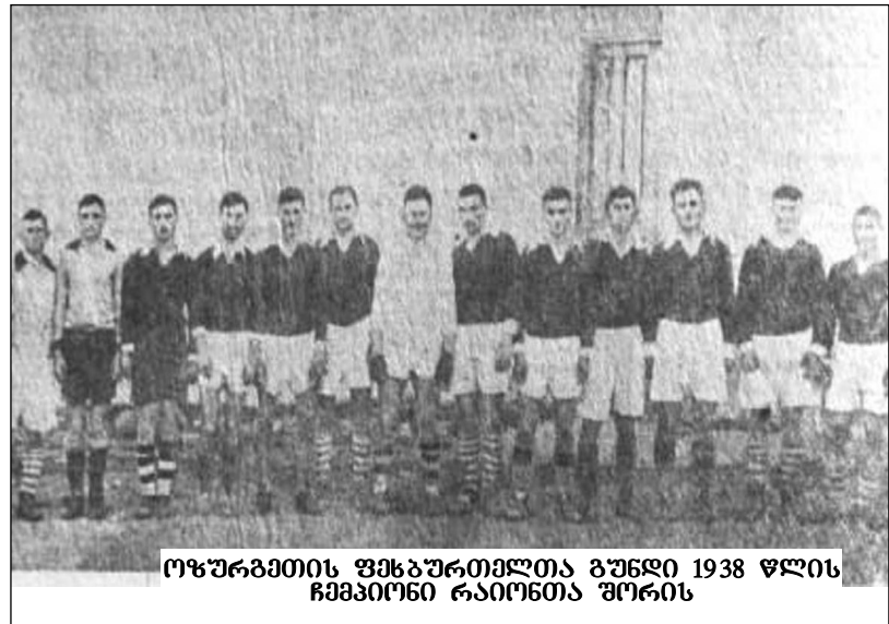
ოზურბაითის ფხვბურთელთა გუნდი 1938 წლის ჩამაიონი რაიონთა შორის

თამაშის დამთავრებას 5 წუთი აკლდა, როდესაც მახარაძელები პენალტით დაჯარიმდა და სამტრ- ედიელებმა შეძლეს ბურთის გატანა.