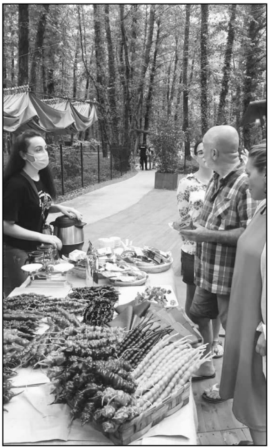
შეკვეთილში, მუსიკოსთა პარკში მდებარე სოციალურ სივრცეში, ყოველკვირეულად, ახალგაზრდა ფერმერთა წახალისებისა და საოჯახო სასოფლო-სამეურნეო ტრადიციების გაგრძელების ხელშეწყობის მიზნით, ფერმერთა დღეები იმართება.

სოციალური სივრცე, ოზურგეთის მუნიციპალიტეტში მოქმედ საოჯახო მეურნეობებს, პროექტის „ჩაის გზა“ მონაწილეებს საგანგებოდ მოწოდებულ აგრო სივრცეში მასპინძლობს. აგროსივრცეში მისულმა სტუმარმა დააგემოვნა და შეიძინა ეკოლოგიურად სუფთა პროდუქტები: ჩაი, ჩირი, თაფლი და ჩურჩხელა, ასევე მიიღეს ინფორმაცია ოზურგეთის ტურისტული პოტენციალის შესახებ. პროექტის ინიციატორი ოზურგეთის მუნიციპალიტეტის მერიის ეკონომიკის განვითარებისა და ქონების მართვის სამსახურია, ფერმერთა დღე, ყოველ კვირა დღეს მუსიკოსთა პარკის სოციალურ სივრცეში ტარდება. ოზურგეთის მუნიციპალიტეტის მერია მადლობას უხდის შეკვეთილის სოციალურ სივრცეს თანამშრომლობისათვის.