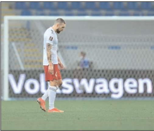
მსოფლიო ჩემპიონატის შესარჩევ ციკლში საქართველოს ნაკრებმა 9-წლიანი წარუმატებელი სერია გააგრძელა, "ჯვაროსნები" ისევ დამარცხდნენ შეხვედრაში, სადაც მათგან აუცილებელ გამარჯვებას (სათქმელია, რამდენად ობიექტურად) ველოდით.