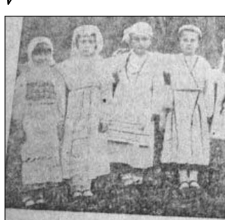
სარეწაო კოოპერატივის საბავშვო მოედნის ბავშვები თამაშობის დროს