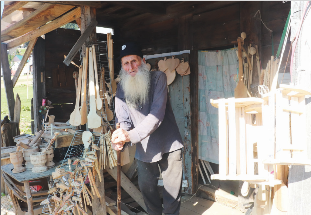
ალიონი. წინა საუკუნეებში ხის ნაკეთობანი, საოჯახო ნივთები აუცილებლობას წარმოადგენდა, რადგან ლითონის ჭურჭელი დიდი ფუფუნება იყო და იგი ძირითადად სპილენძით თუნგით და კარდალათ შემო-იფარ-გლებოდა. ფართოდ გამოიყენებოდა ქვის და ხის

ნაკეთობები – ხის გობი, ხის ჯამები,ფილი, კეცი, ჩაბური, კოპე, ორკოპე, კერია და ა.შ. დღეს იშვიათად შეხვდები აჭარა-გურიის მთებში ცხენებს ხის გორდებით, რითაც ყველი, კარაქი, ხილი, მოცვი და სხვა გადაჰქონდათ კურორტ ბახმაროსა და გომისმთაზე დამსვენებლებისათვის მისაყიდად ან მთიდან ბარში.