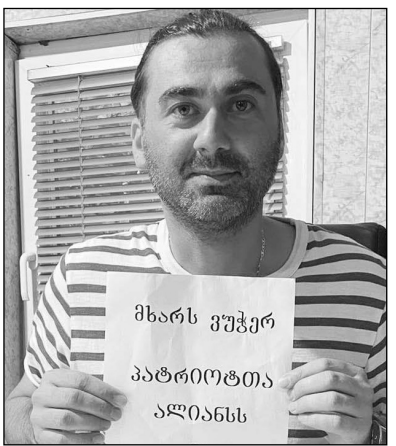
მხარს ვუჭერ პატრიოტთა ალიანსს