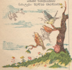
მეშენი ფრთხიანი ნახატები შალვა ცხადაძისა

გუგულები დაფიქრდნენ, შემდეგ შეხ- ვეული ნეკრჩხლის ფოთოლი ნიბლიას გადასცეს, თანაც მოიბოდიშეს:— ცოტა ძღვენი მოგიტანეთო, მშვიდობით თუ დავბრუნდით თბილ ქვეყნიდან, მეტ პატივ- სა გცემთო.— და გუგულები გაფრინდნენ.