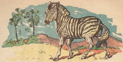
ნახ. 6. ფალანგიანი ზევილისა