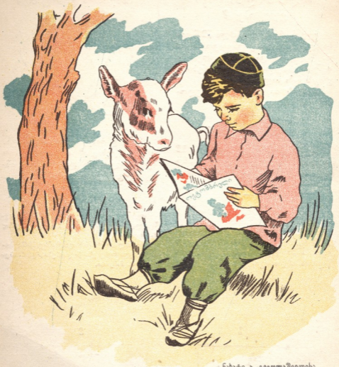
ნახატი ა. ვაგოლაშვილისა