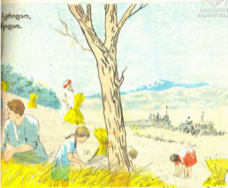
სამეტი ი. ვაღონკვლისა

კელსე და კელსე ნამკელი ნამკელი, სუბო რეანობ, კეკელსე სელესეთა, კესტერ, კამბეს წინაო.