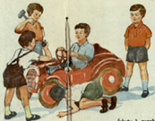
სურათი 2. ვარცხვენისა.