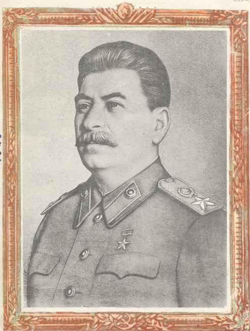
იოსებ ბესარიონის-ძე სტალინი