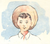
ნახატები გ. როინიშვილისა