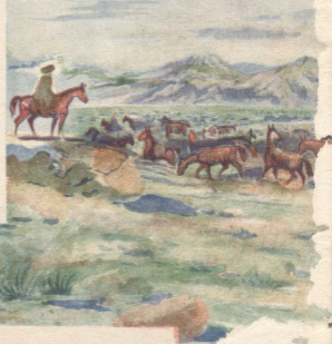
ყლის მხატვრობა ნ. მაისაშვილისა

ბასუინსმეცხეული რედაქტორი რ. შარშიანი სარედაქციო კოლეგია: შ. აბაშიძე, შ. ბურჯანაძე, ი. შარშიანი, თ. თუ. შვილი, შაჰვ. შარშიანი, ი. სიხარულიძე, ნ. უნაფროშვილი, ზ. ცხადაძე. გამომცემლობა „კომუნისტი“. რედაქციის მისამართი: თბილისი, ლენინის ქ. № 14. 1 სართ. ტელ. 3-81-85 გამომცემლობის შეფ. № 51 სტამბის შეფ. № 376/757 ტირაჟი 7000 ფე 01816 ფასი 5 მან. ტექსტი აწარმოდა ლ. პ. შერიას სახელობის პოლიგრაფკომბინატ „კომუნისტის“ სტამბაში, ყურნალი დაამუშავდა ოცნეტის სისტემის მანქანაზე „ზარია ვოსტოკას“ სტამბაში, თბილისი, რუსთაველის პროსპექ. № 42