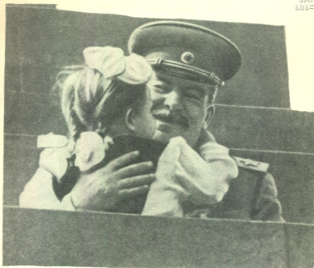
იოსებ ბესარიონის-ძე სტალინი მავზოლეუმის ტრიბუნაზე 1952 წლის საკირავდებისო დემონსტრაციის დღეს