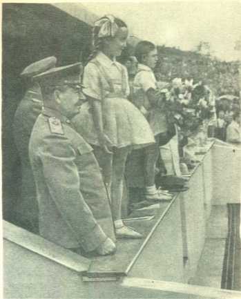
ფიგურბუჩქელთა საკავშირო ჰარადი ღინამოს სტადიონზე 1947 წლის 20 ივნისს