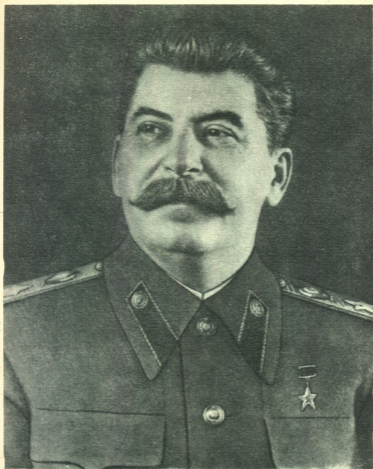
იოსებ გენერალის-კე სტალინი