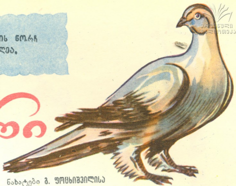
ნახატები მ. უმხინოვიჩისა