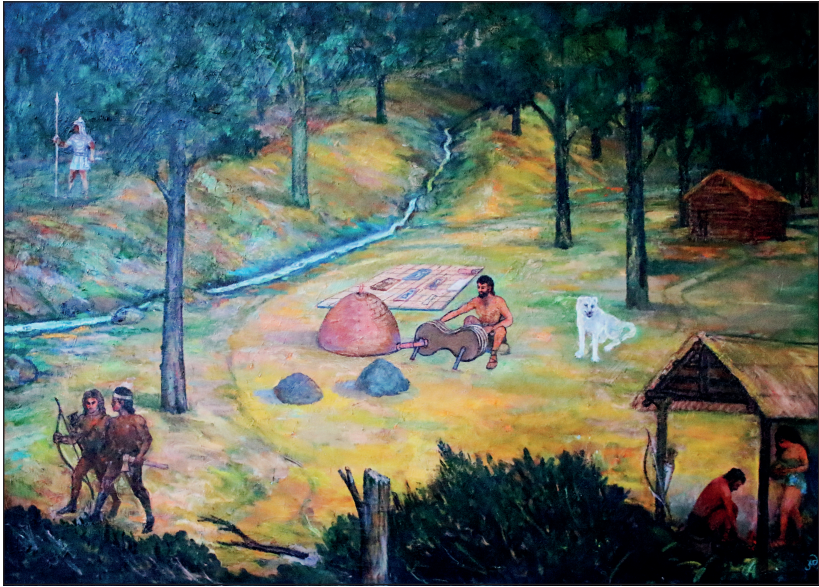
ჩაკვი, რკინის სადნობი სახელოსნო (ძვ.წ. XI-X სს.). რეკონსტრუქცია. იდეის ავტორი ნიაზ ბოლქვაძე; მხატვარ-არქიტექტორი ჯემალ მიქელაძე Chakvi, Iron Workshop (XI-X centuries BC). Reconstruction Author of the idea Niaz Bolkvadze; Artist-Archeologist Jemal Mikeladze