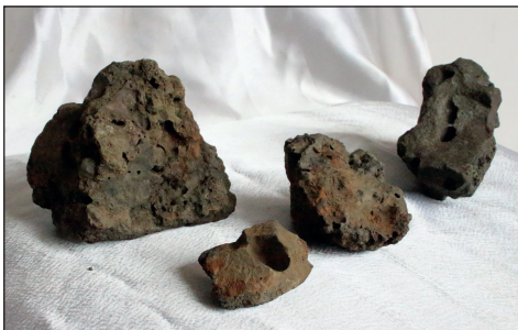
რკინის წილა, ჩოლოქი, ლეღვა. ძვ.წ. XIII ს. Ferrous slag, Cholokhi, Leghva. XIII c. B.C.