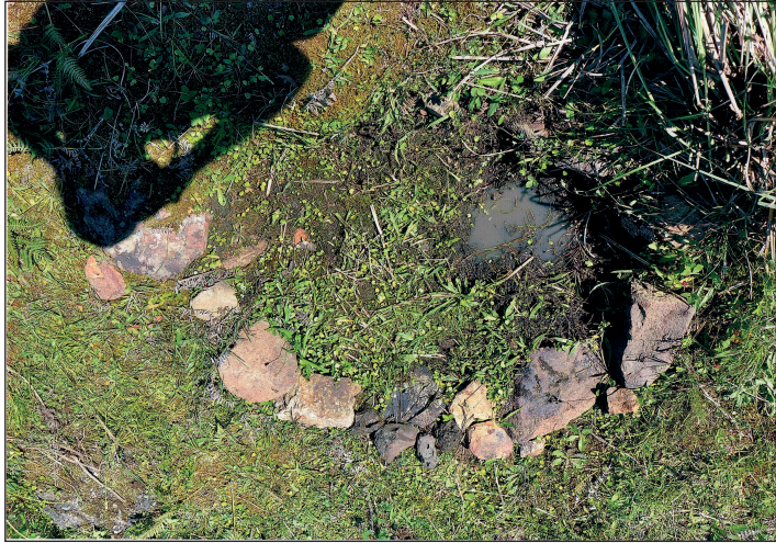
ჩოლოქი, ლეღვა, რკინის სადნობი ქურა-სახელოსნო, ძვ.წ. XIII ს. Choloki, Leghva, steelmaking furnace – XIII c. B.C.