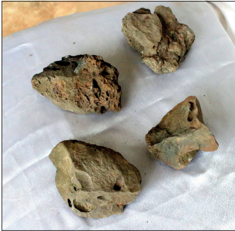
რკინის წილა. ჩაქვი, ჩაისუბანი. ძვ.წ. XI-X სს. Ferrous slag, Chakvi, Chaisubani, XI-X cc. B.C.