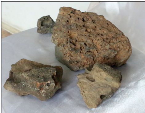
რკინის წილა, ჭოროხი, ჭარნალი. ძვ.წ. IX ს. Ferrous slag, Chorokhi, Charnali, IX c. B.C.