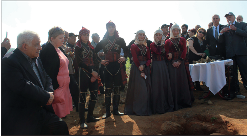
უძველეს კოლხთა რკინის სადნობი სახელოსნოს ტერიტორიაზე. ჩაქვი, მაისი, 2018 წ. On the territory of ancient Iron Workshop of Colchis. Chakvi, May, 2018.