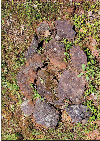
ჭოროხი, ჭარნალი, რკინის სადნობი ქურა-სახელოსნო, ძვ.წ. IX ს. Chorokhi, Charnali, steelmaking furnace, workshop, IX C. B.C.